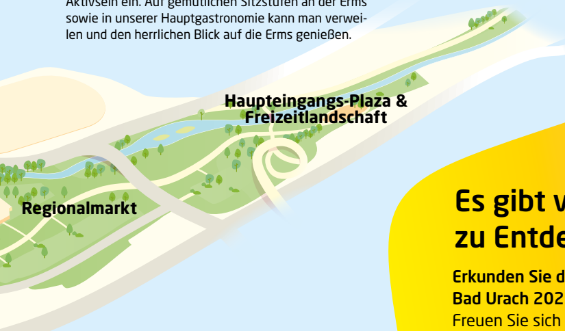
Haupteingangs-Plaza & Freizeitlandschaft

Die Altstadt von Bad Urach bildet das lebendige Herz der Stadt und begeistert mit ihrem historischen Charme. Der Marktplatz mit dem spätgotischen Brunnen und den charakteristischen Fachwerkhäusern prägt das Stadtbild. Residenzschloss und Amanduskirche erzählen eindrucksvoll von der Geschichte Bad Urachs.